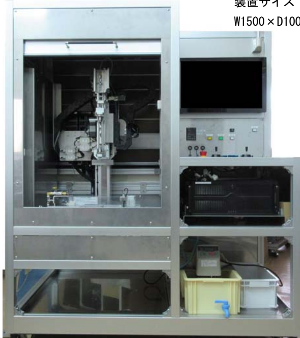
装置サイズ [mm] W1500×D1000×H1800